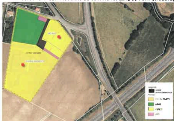
TA à reverser à la Communauté de communes (ZAE Le Pont Girouard)

Il précise que pour Saint-André-Goule-d'Oie la seule zone concernée actuellement est celle du Pont Girouard :